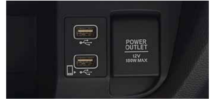
12 V power outlet and 2 USBs for smartphones connectivity or simply charging your devices.