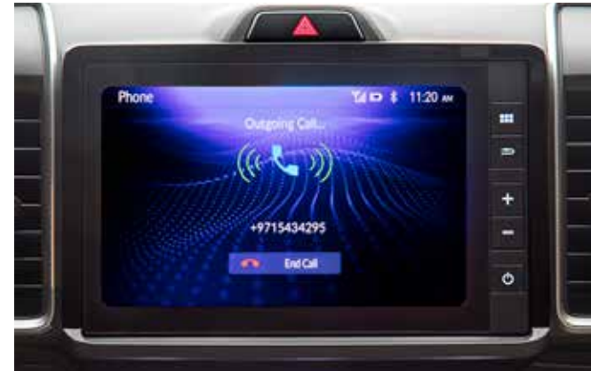
معاير راديو إف إم Handsfree Calling