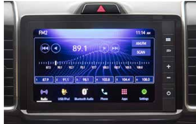
FM Radio Tuner